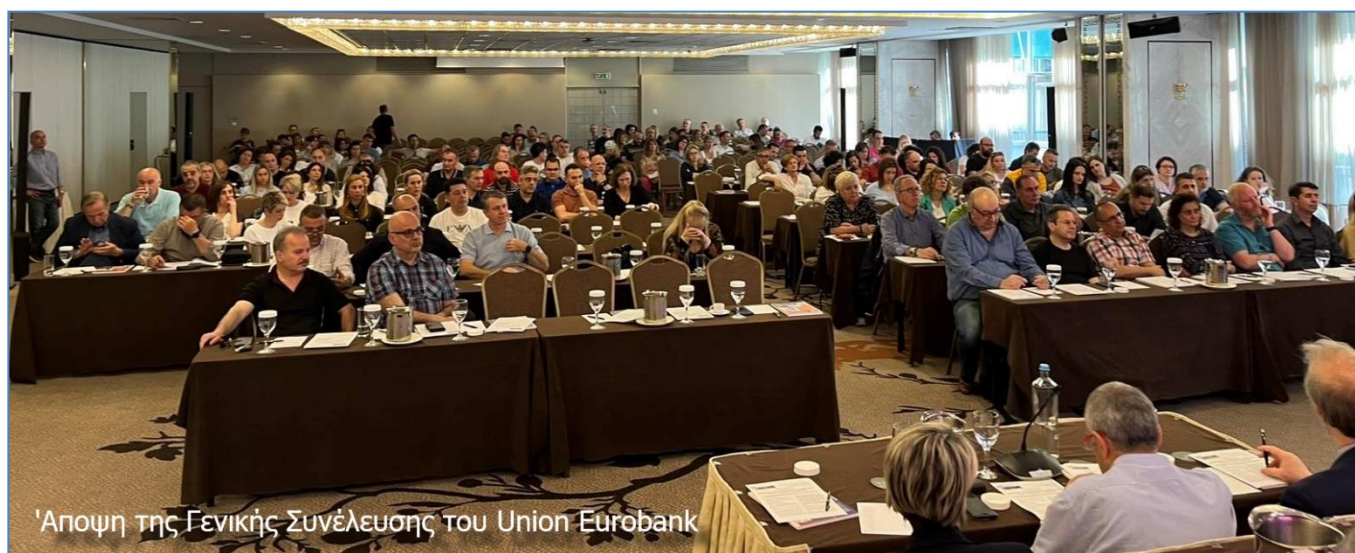
Άποψη της Γενικής Συνέλευσης του Union Eurobank

Ευχαριστούμε και από το σημείο αυτό τα μέλη μας για την εμπιστοσύνη που μας περιβάλουν, μέσω των συντριπτικών αυτών ποσοστών έγκρισης των πεπραγμένων του Δ.Σ.